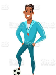
BEDEN EĞİTİMİ ÖĞRETMENİ