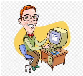
BİLİŞİM TEKNOLOJİLERİ ÖĞRETMENİ