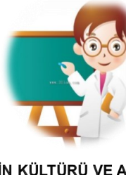
DİN KÜLTÜRÜ VE AHLAK BİLGİSİ ÖĞRETMENİ