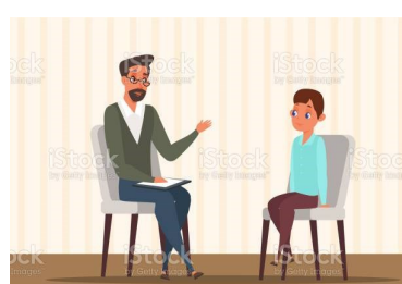
PSİKOLOJİK DANIŞMAN VE REHBERLİK ÖĞRETMENİ