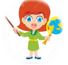
SOSYAL BİLGİLER ÖĞRETMENİ