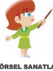
GÖRSEL SANATLAR ÖĞRETMENİ