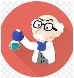
FEN VE TEKNOLOJİ ÖĞRETMENİ